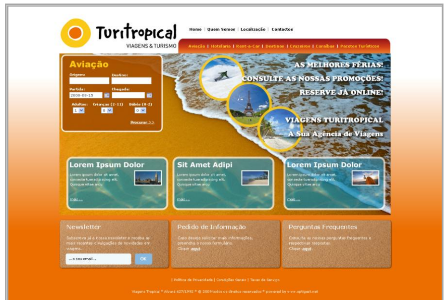
Ilustração 1 – Exemplo de Página Inicial