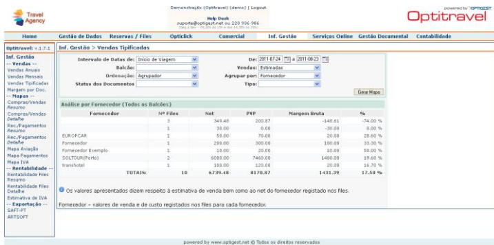
Ilustração 2 – Consulta de Mapa de Vendas Tipificadas