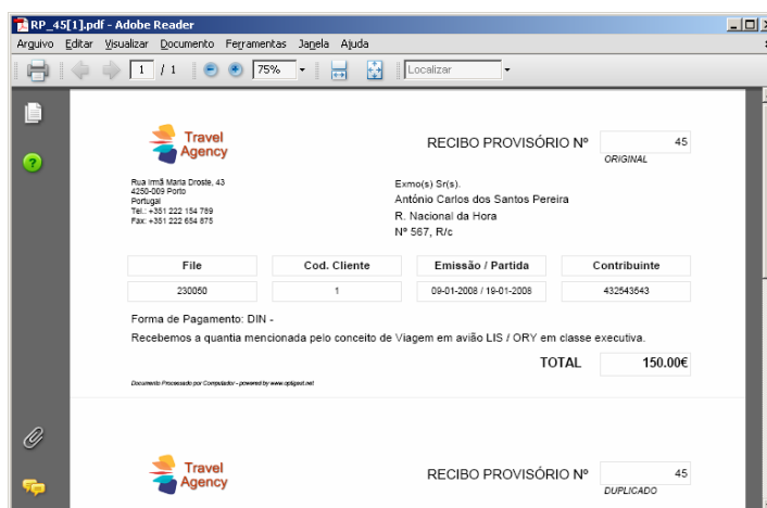
Ilustração 2 – Recibo Provisório